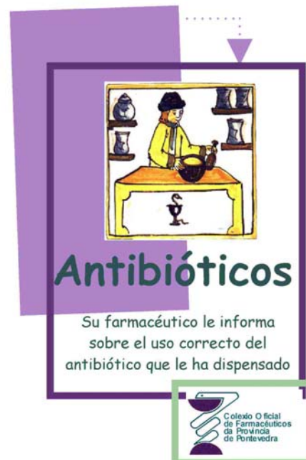
Figura 2. Hoja informativa con instrucciones específicas para el paciente

El farmacéutico es el experto en MEDICAMENTOS. No dude en acudir a él ante cualquier problema relacionado con su medicación